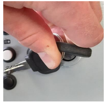
ignition / engine start