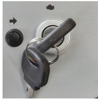
pre-annealing / ON